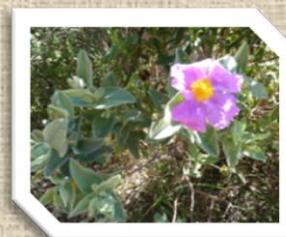
Le Ciste cotonneux