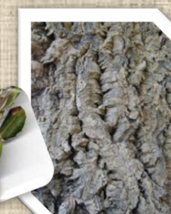
Le chêne liège