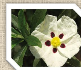
Le Ciste ladanifère