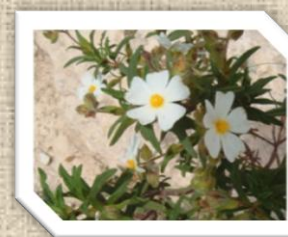
Le Ciste de Montpellier