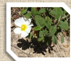
Le Ciste à feuilles de Saugé