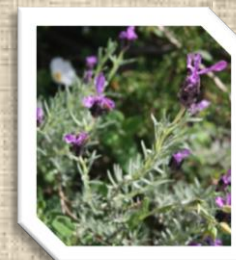
La Lavande stéchade