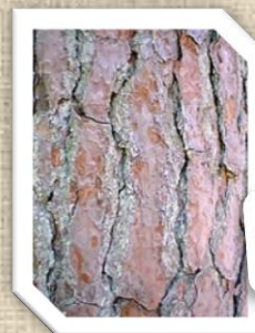
Le Pin maritime